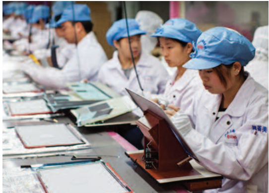
ΤΑ iPad ΤΗΣ APPLE ΚΑΤΑΣΚΕΥΑΖΟΝΤΑΙ ΣΕ ΕΡΓΟΣΤΑΣΙΑ-ΚΕΣ ΕΓΚΑΤΑΣΤΑΣΕΙΣ ΣΤΗΝ ΚΙΝΑ

Το κεφάλαιο δεν είναι μόνο οι κεφαλαιούχοι επιχειρηματίες. Είναι το όλο σύστημα, ένα «παιχνίδι» με κανόνες που όλοι οφείλουν να ακολουθούν. Όσο η εργασία αλλοτριώνεται απ' τη μία τάξη στην άλλη, η καθημερινή κοινωνική διεργασία δημιουργεί