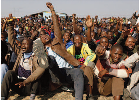
ΜΕΤΑΛΛΟΥΡΓΟΙ ΣΤΗ Ν. ΑΦΡΙΚΗ ΑΠΕΡΓΟΥΝ ΓΙΑ ΥΨΗΛΟΤΕΡΟΥΣ ΜΙΣΘΟΥΣ, ΑΝΤΙΣΤΕΚΟΝΤΑΙ ΣΤΗΝ ΑΣΤΥΝΟΜΙΚΗ ΚΑΤΑΣΤΟΛΗ ΚΑΙ ΠΡΟΚΑΛΟΥΝ ΚΡΙΣΗ ΣΕ ΕΘΝΙΚΟ ΕΠΙΠΕΔΟ (2012)

Ο κομμουνισμός είναι γέννημα του καθημερινού αγώνα των ανθρώπων για ελευθερία. Σε πολλά σημεία στην ιστορία τα κινήματα προχώρησαν πέρα απ' τις διεκδικήσεις μικρών μεταρρυθμίσεων, υψηλότερων μισθών, ή αλλαγής της κυβέρνησης. Απέκτησαν τόση ορμή που εν τέλει ολόκληρο το καπιταλιστικό σύστημα αμφισβητήθηκε.