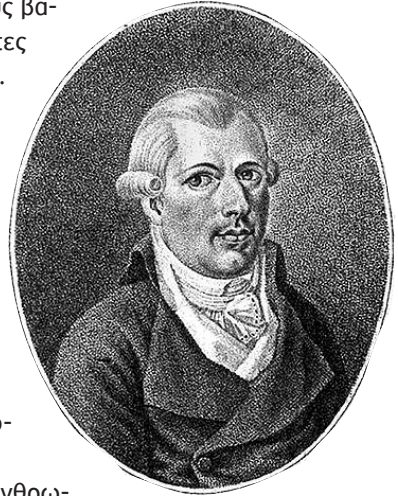
Ο ADAM WEISHAUPΤ

οποίο οι άνθρωποι ζούσαν για αιώνες, με τους βασιλείς και ιερείς στην κορυφή και τους αγρότες στη βάση της πυραμίδας, άρχισε να καταρρέει. Στην Ευρώπη αναδύθηκε μία τάξη πλούσιων εμπόρων που επιχειρούσαν σε απομακρυσμένες περιοχές της υδρογείου. Νέες τεχνολογίες αναπτύχθηκαν και μαζί μ' αυτές, νέα είδη εξειδικευμένων εργατών. Αυτές οι νέες τάξεις άρχισαν να αποκτούν περισσότερη δύναμη απ' τους βασιλείς, οι οποίοι υποτίθεται ότι ήταν κυρίαρχοι, βάσει του νόμου και της παράδοσης. Η Αμερικανική Επανάσταση 3 έδειξε τη δύναμη αυτών των τάξεων σ' ολόκληρο τον κόσμο.