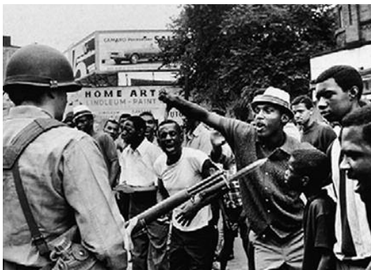
ΤΑΡΑΧΕΣ ΣΤΟ ΝΙΟΥΑΡΚ ΤΟΥ ΝΙΟΥ ΤΖΕΡΣΕΪ, ΙΟΥΛΙΟΣ 1967

Στα μέσα της δεκαετίας του '70 το μαύρο κίνημα έπνεε τα λόισθια. Οι εξεγέρσεις είχαν κατασταλεί με τη δύναμη των όπλων και οι επαναστάτες είχαν σκοτωθεί ή φυλακιστεί. Ο αμερικανικός καπιταλισμός κατέφυγε σε κάποιες συμβιβαστικές μεταρρυθμίσεις, έτσι ώστε να εκτονωθεί και να διαλυθεί η ορμή του κινήματος: εξελέγησαν μαύροι δήμαρχοι σε διάφορες πόλεις των ΗΠΑ και άνοιξαν νέες θέσεις εργασίας