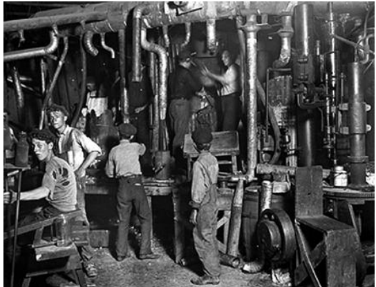
Η ΔΟΥΛΕΙΑ ΣΤΑ ΕΡΓΟΣΤΑΣΙΑ ΗΤΑΝ ΕΞΑΝΤΛΗΤΙΚΗ ΚΑΙ ΕΠΙΚΙΝΔΥΝΗ, ΟΠΩΣ ΚΑΙ ΣΕ ΠΟΛΛΑ ΕΡΓΟΣΤΑΣΙΑ ΣΗΜΕΡΑ.

Το μεγαλύτερο μέρος του εγγράφου είναι μια αναίσχυνη αντιγραφή από δύο άλλα βιβλία: το Διάλογοι στην Κόλαση ανάμεσα στον Μακιαβέλι και τον Μοντεσκιέ 11 του Μαυ-